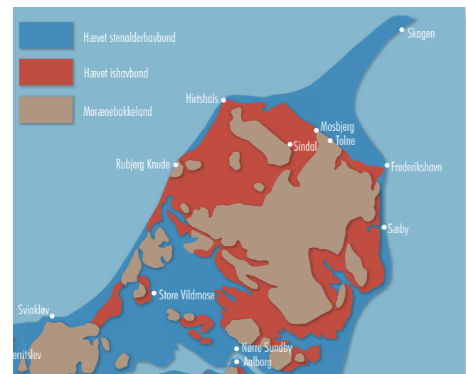
Landskabskort over Vendsyssel

Det flade landskab er dannet af et koldt, arktisk ishav. Det dækkede området samtidig med at isen stadig var i Kattegat, tæt på Vendsyssels østkyst. På havbunden blev aflejret sand nær kysterne og ler på det dybere vand.