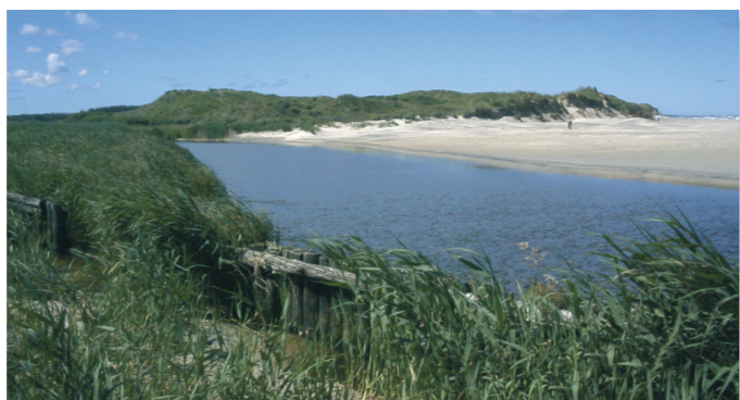
Uggerby Å's udløb vest for Tversted

Det er 13.000 år siden ishavet dækkede området, og havstigningen blev overhalet af landhævningen, hvorved de flade områder blev tørlagte. I tiden efter blev landskabet præget af vandets og vindens nedbrydende kraft, og Liver Å og Uggerby Å formede markante ådale i de tidligere havdækkede flader.