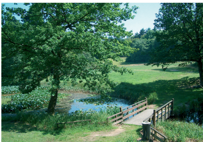
Søen ved parkeringspladsen ved Tolne Skovpavillon

Fredningen blev gennemført i 2000 og udgør den nordligste del af Tolne Skov. Målet med fredningen er at skabe et stort sammenhængende område med urørt skov bestående af hjemmehørende træarter. De oprindelige bøge er nogle af de nordligste i Vendsyssel og vil blive en væsentlig frøkilde til den kommende skov, der gerne ses domineret med bøg, men også mange andre træer og buske. Du kan læse mere om Tolne Skov i den folder Nordjyllands Amt har udgivet.