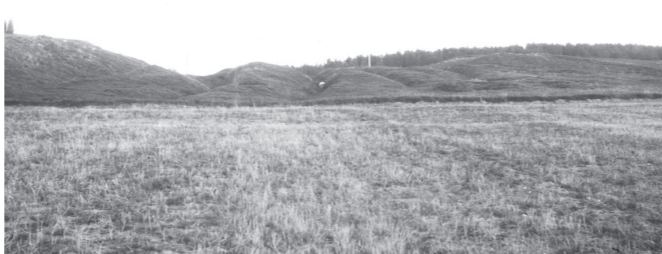
Hulvejene i Mørkhulebakke anno 1921

I nordkanten af plantagen ligger Mørkhulebakke. Midt gennem bakken er der en lavning med en jordvej og et system af syv hulveje. Hulvejene er smalle og dybt nedskårne i bakken.